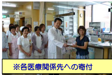
※各医療関係先への寄付