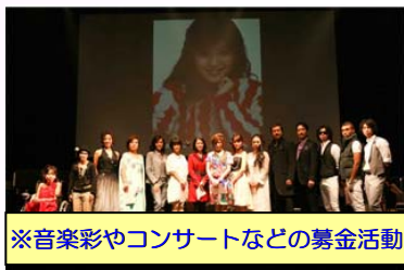
※音楽彩やコンサートなどの募金活動